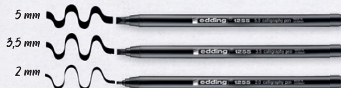
edding 1255 kaligrafický popisovač

F ixy s kaligrafickými hroty dokážou ozdobit krasopísmem nejrůznější povrchy. Zkuste je využít pro popis pohlednic, narozeninových přání, balíčního papíru nebo v bullet-journalu. Na papír, lepenku a plátno, ale i na dřevo a terakotu využijete edding 1255 a edding 1455 – mají inkoust na bázi vody, jejich stopa rychle zasychá, nerozmaže se. Pigmentový inkoust je vysoce světlostálý a nepropíjí se papírem. Fix edding 1255 s pevným hrotem je vhodný i pro začátečníky. Pro pokročilejší uživatele je pak edding 1455 s flexibilním hrotem . Pro práci na náročnějších površích (křídový papír, keramika, sklo a plast) doporučujeme edding 753 s lakovým inkoustem a pevným hrotem, který má vysoce krycí vlastnosti a umožní psaní i na tmavé a transparentní povrchy. Napsaná stopa je po zaschnutí voděodolná, světlostálá a ořezu odolná, a proto je popisovač vhodný i pro exteriér.