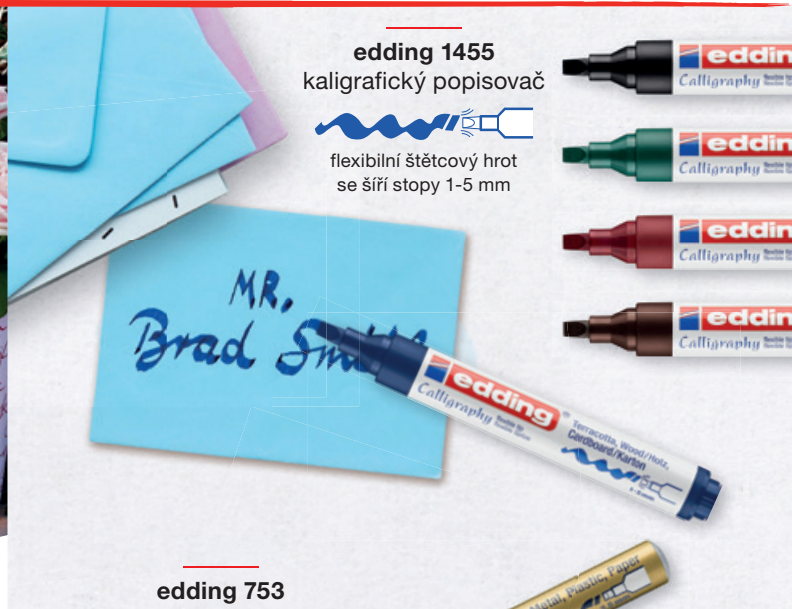
edding 1455 kaligrafický popisovač